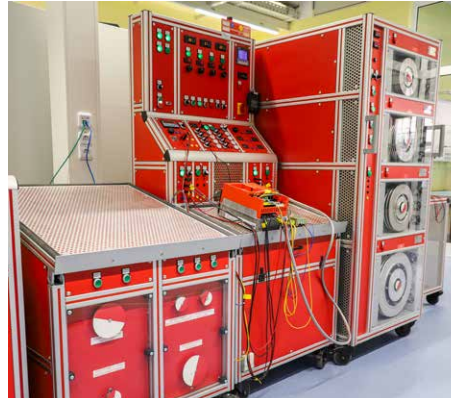
Univerzális állvány frekvenciaváltókhöz

Egyablakos szolgáltatásaink segítenek az idő és az erőforrások megtakarításában. Nincs szükség az utódtermékekre történő időigényes áttérésre. Gépei és berendezései tanúsításai érvényben maradnak. Ezzel nemcsak a karbantartási költségeket optimalizáljuk, hanem arról is gondoskodunk, hogy gépei és berendezései hosszú távon kapjanak „megfelelő áramot”.